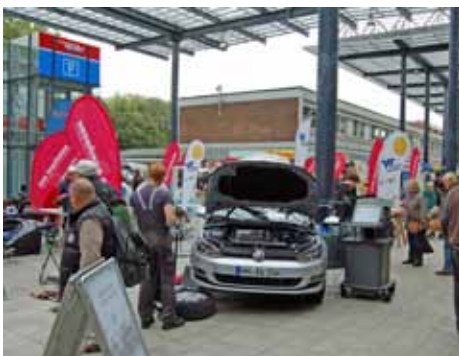
Autoinspektion: Tag des Handwerks (Foto: Peter Heine, Handwerkskammer Hamburg).

leben. Die große, 100 Jahre alte Eiche auf dem Platz bleibt natürlich erhalten. Das Grundstück ist im Eigentum des Bezirksamtes Hamburg-Nord und wird es auch bleiben. Und so ist das Bezirksamt aktuell auf der Suche nach einem privaten Investor, der den Neubau errichten und die Gastronomie langfristig betreiben möchte. Interessierte Investoren und Betreiber können die Ausschreibungsunterlagen bis zum 31.10.2013 beim Bezirksamt anfordern unter: MR@hamburg-nord.hamburg.de. Der Einsendeschluss für die Bewerbungsunterlagen ist der 20. November. Mit dem Neubau soll möglichst noch vor Umgestaltung des Bahnhofsvorplatzes begonnen werden, um keine weiteren Verzögerungen beim Baufortschritt hervorzurufen.