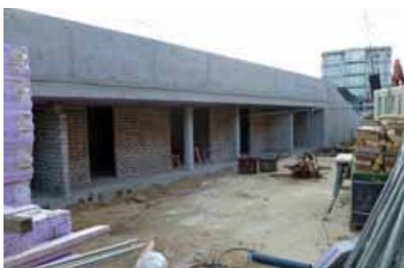
Das Foto wird noch aktualisiert.

die auf Höhe der neuen Fußgängerampel vom Krohnstieg auf den Marktplatz führt. Die öffentlichen Toiletten werden