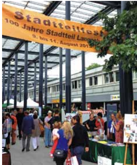
Gelungenes Sommerfest: 100 Jahre Langenhorn.

unterhielten. Höhepunkte waren dabei "Fräulein Menke", die zu Bestform auflief, und die Bands aus Langenhorn, die ihren Heimvorteil geschickt nutzten und sich eindrucksvoll und professionell prä-