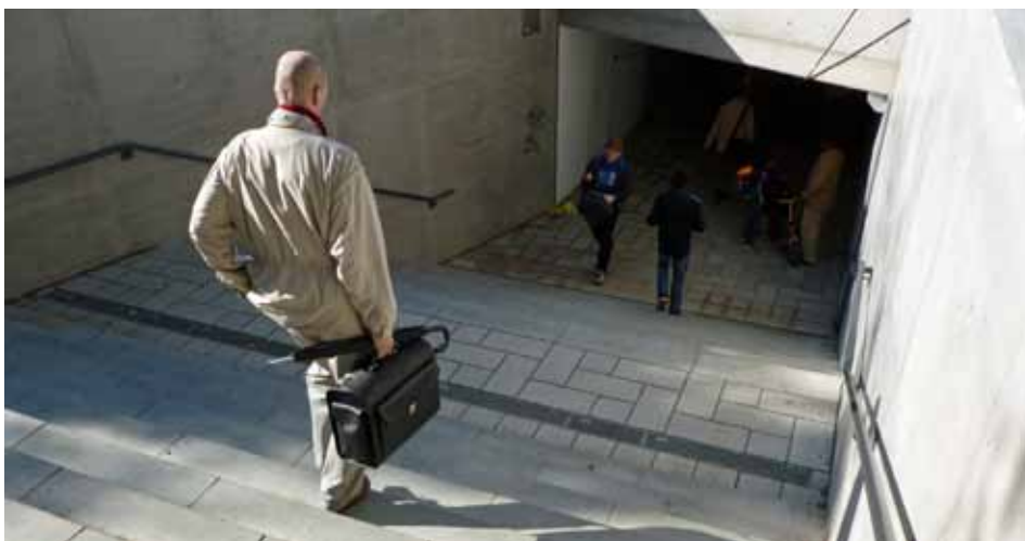
Heller und freundlicher samt neuer Treppe: Der neue Tunnel.

die Tunneleingänge, als auch die verwendeten Kacheln mit einer speziellen Beschichtung versehen, die das Anhaften von Farbe erschwert bzw. eine schnelle Reinigung ermöglicht. In den kommenden Wochen wird außerdem ein Infokasten am Tunneleingang auf dem Marktplatz angebracht. Hier können Sie sich zukünftig stets aktuell über kulturelle Veranstaltungen in Ihrem Stadtteil Langenhorn informieren.