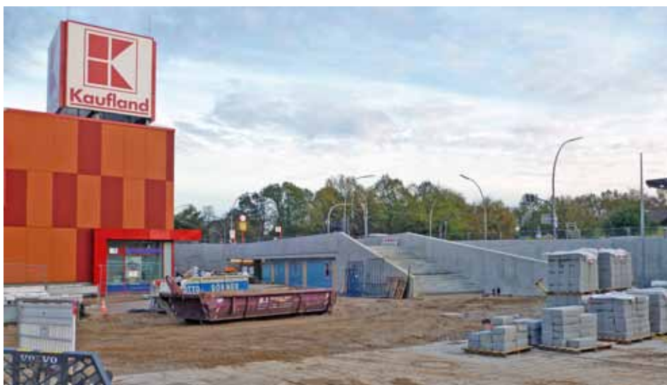
Die Treppen- und Rampeanlage im Rohbau

Frühjahr 2014 auf die dann neu gestaltete und mit moderner Technik ausgestattete Marktfläche. Auch die Arbeiten am Marktmeisterbüro und der öffentlichen barrierefreien WC-Anlage laufen weiterhin im vorgesehenen Zeitplan. Nachdem im November die Fassadenelemente eingesetzt wurden, wird im Moment der Innenausbau durchgeführt und die Baumaßnahme wird entsprechend termingerecht ebenfalls im Frühjahr 2014 abgeschlossen sein.