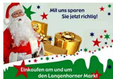
Tolle Rabatte beim Weihnachtseinkauf

möchte, der sollte sich mit dem Weihnachtlichen Gutscheineheft aufmachen zum Shoppen rund um den Langenhorner Markt.