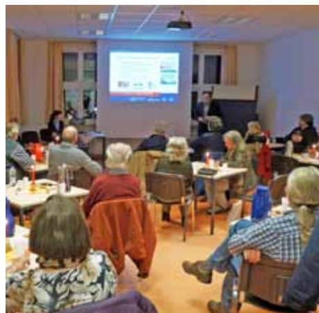
Jahresausklang im 11. Quartiersforum

formationen zum aktuellen Stand des bewilligten Antrages des Weihnachtli-