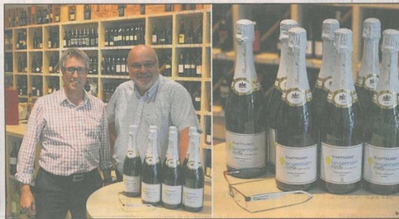
Es prickelt: Der Langenhorn-Stadtteilsekt aus dem Hause Lehmitz.

Das für das Logo verwendete Eichenblatt stellt den Bezug zum Langenhorn-Stadtwappen her, die Farben Grün und Blau stehen für Frische, Offenheit, Bodenständigkeit und Gesundheit. Um die räumlichen Teilbereiche des Zentrums – den Marktplatz mit Kaufland und P+R Gebäude, das Einkaufszentrum, die südliche Tang-